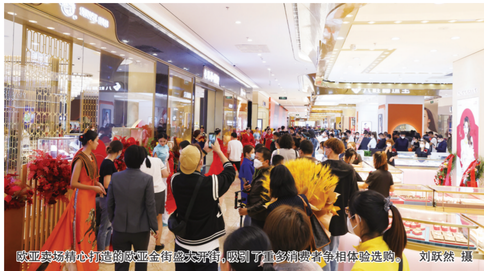
欧亚卖场精心打造的欧亚金街盛大开街，吸引了众多消费者争相体验选购。

近年来，随着人们追求美好生活和投资理财观念增强，同时承载这两种需求的黄金饰品、金条金币等销量逐年走高，品质化、个性化、IP化的黄金珠宝饰品逐渐成为主力消费群体首选。特别是在当前地缘冲突、疫情蔓延、通胀高企等因素叠加下，黄金作为硬通货，能避险保值，易保管增值，抗通胀易变现，避险保值功能凸显，用于投资的金条、金条等黄金产品越来越受到年轻消费者追捧。作为担负长春市六城联动战略支点之一新兴消费城市建设重任的欧亚卖场，按照欧亚集团曹和平董事长培植核心竞争力、不断壮大差异优势的指示，顺势求变，主动作为，智慧运作，发挥多年黄金珠宝品牌运营经验和知名品牌稳定合作资源等优势，在考察调研、精准研判、规划洽谈基础上，在1号门到8号门之间倾力打造了全国