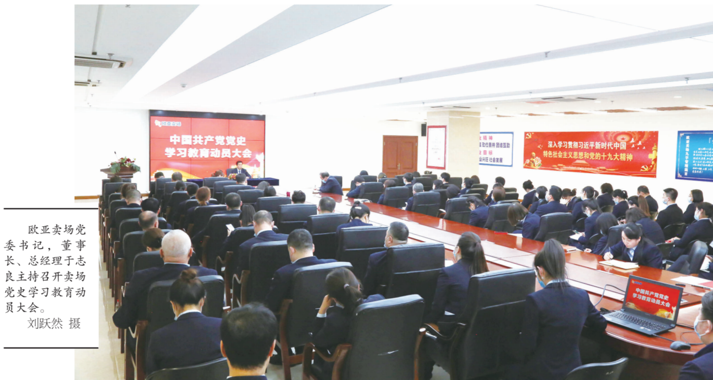
欧亚卖场党委书记、董事长、总经理于志良主持召开卖场党史学习教育动员大会。

鉴往取今,向史而新。于总强调,对广大党员和管理人员来说,要把学习党史中坚定的信仰信念、汲取的智慧力量、传承的传统作