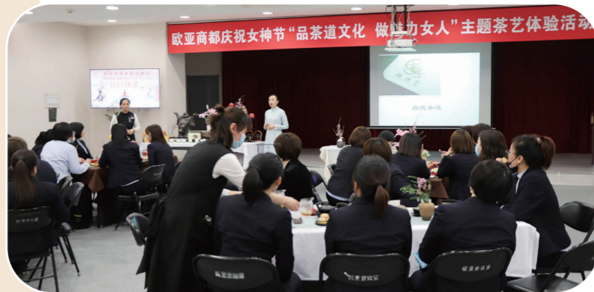
欧亚商都开展庆祝女神节主题茶艺体验活动。