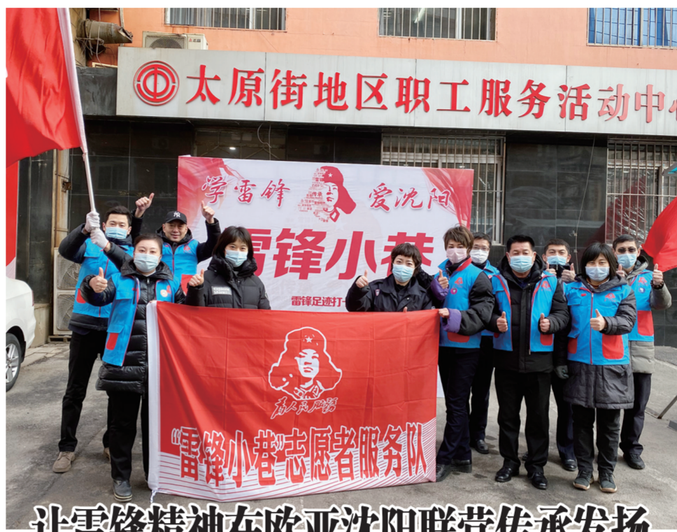
让雷锋精神在欧亚沈阳联营传承发扬

脚踏实地的真努力,真正的努力。是“富贵本无根,尽从勤里得”的踏实;是“读书破万卷,下笔如有神”的勤奋;是“欲穷千里目,更上一层楼”的精进,真正的努力,都不喧嚣。只需要卷起袖子,行动起来。让我们共同脚踏实地,从心出发,做个努力的人! (双辽欧亚 刘保权)