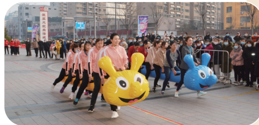
济南欧亚大观乐活城开展三八趣味体育活动。