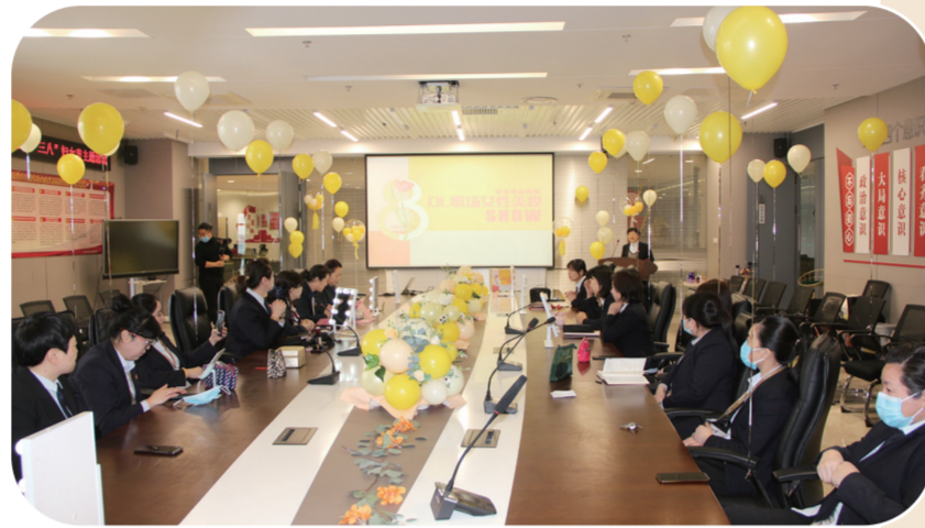
欧亚商业连锁总部女员工参加三八节主题活动现场。