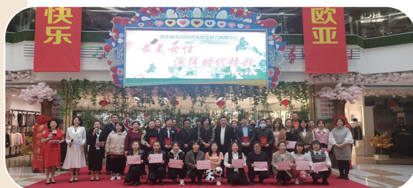
琿春欧亚延百女神节活动现场。