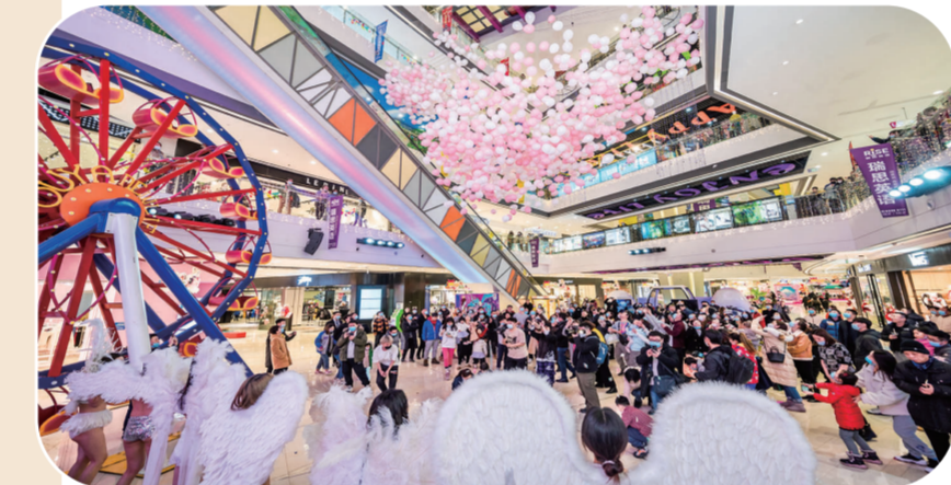
三八节当天，欧亚新生活甜蜜气球糖果雨从天而降。