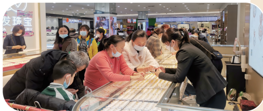
欧亚春城购物中心三八节黄金珠宝热销。