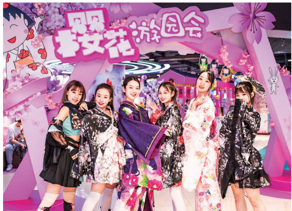
欧亚新生活樱花游园会开街，吸引了众多和服和COSPLAY爱好者前来打卡。

欧亚新生活各商场紧密配合巡游，为追随巡游而来的顾客发放品牌专柜提供的小礼品、优惠券、宣传单，挖掘二次引流商机，让文化活动带来客流的同时，带动销售的提升，以实现品牌与商场的良性互动和共赢。