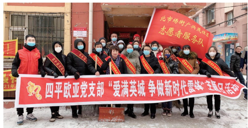
四平欧亚党支部开展“爱满英城 争做新时代雷锋”主题党日活动。

扫积雪,身体力行参与文明城市创建,为打造“美丽四平 幸福家园”贡献出我们的力量。雷锋精神是中华民族宝贵的精神财富,“诚信、感恩、敬业、突破、传承、志愿”是新时期雷锋精神的集中体现,它激励着四平欧亚的党员们焕发出勃勃生机与活力,弘扬了中华民族传统美德。 (四平欧亚 综合部)