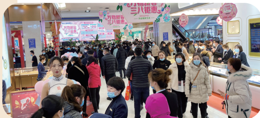
欧亚万豪三八节黄金内购会火爆瞬间。