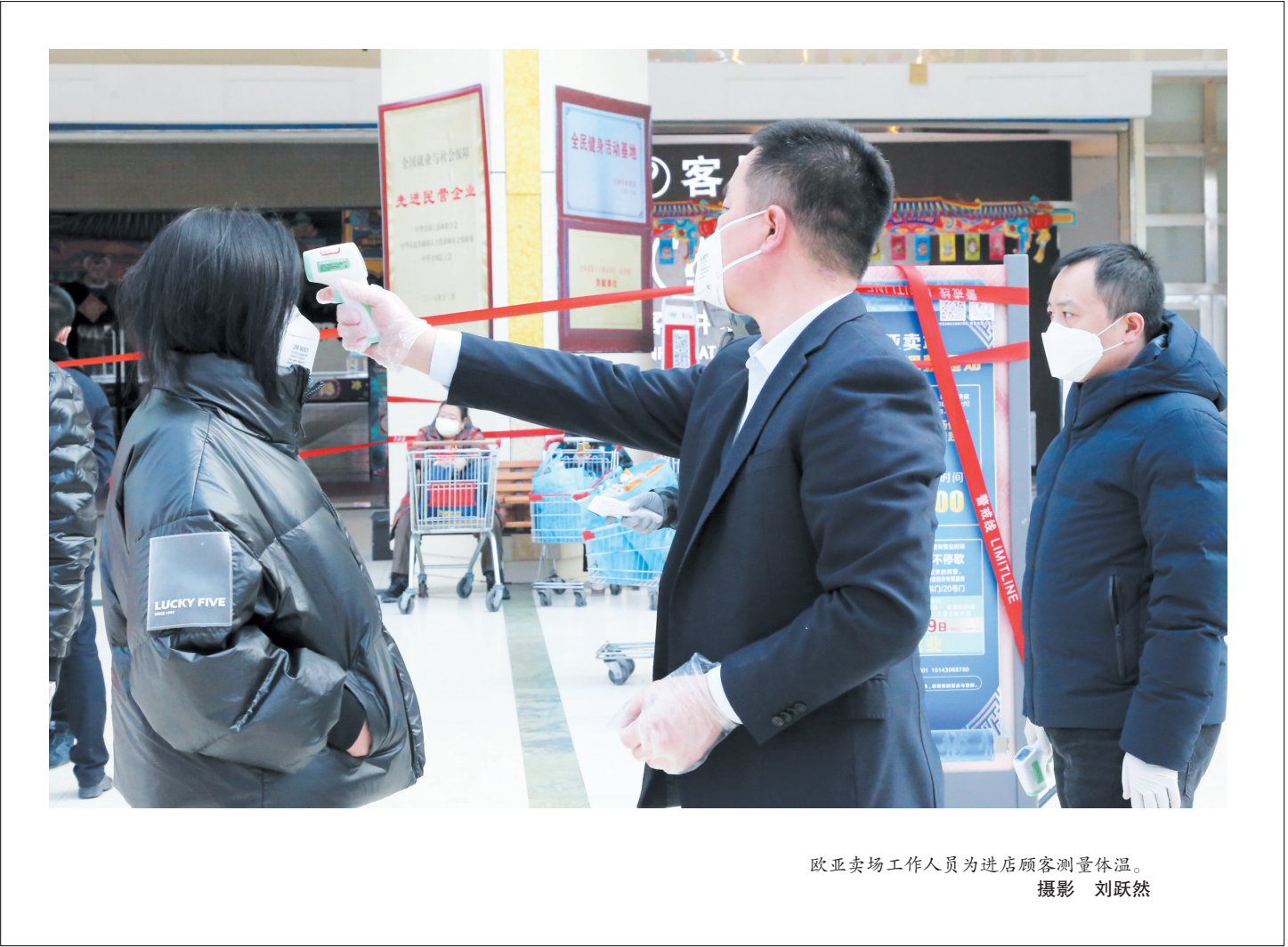
欧亚卖场工作人员为进店顾客测量体温。